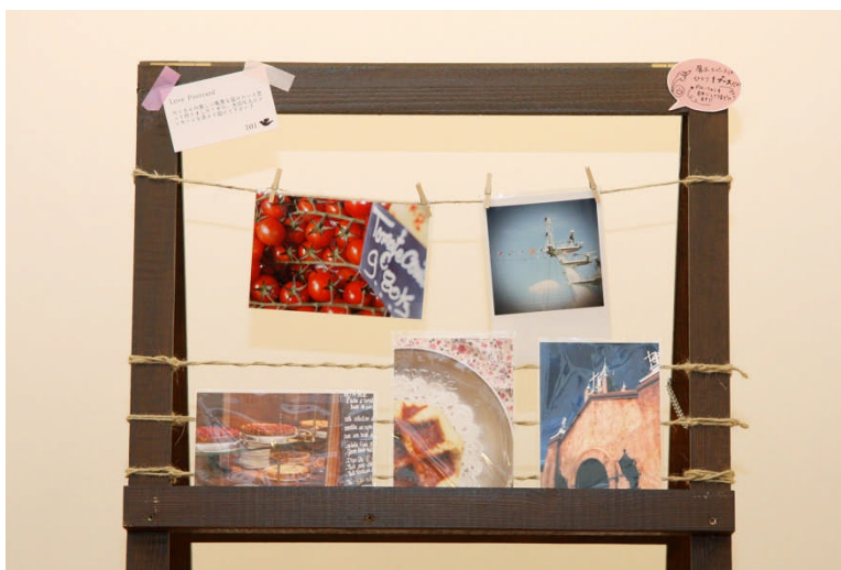
【2】ブースのデコレーションイメージ サンプルイメージ

※【2】写真のブースのデコレーションはあくまでも、サンプルイメージです。色々なパターンに出来ます。